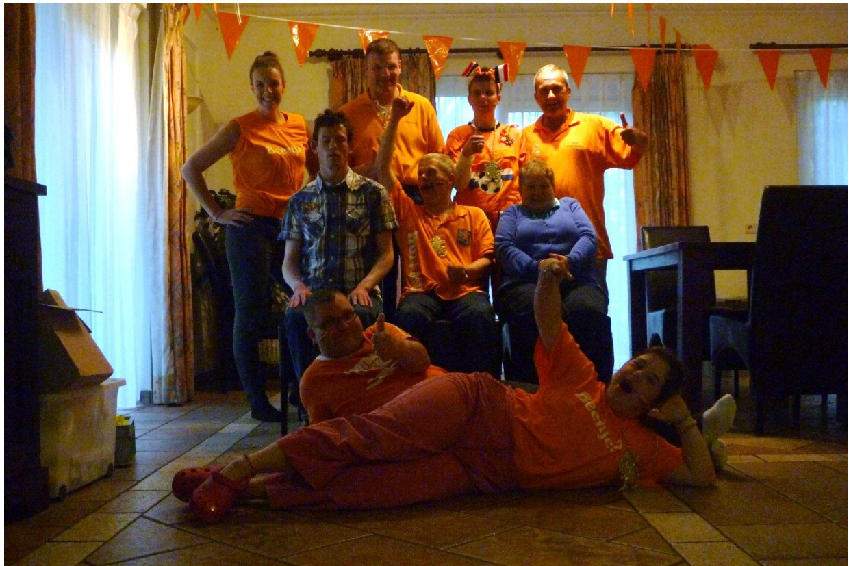
Verlenging en penalty's. Helaas verloren, maar morgen naar Walibi!! Dus lekker slapen!